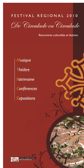
Couverture de la plaquette Aude