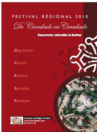
Couverture de la plaquette Hérault

Pour la première fois les deux associations (« De Circulade en Circulade » pour l'Aude , et Association des villages circulaires pour l'Hérault ) travaillent ensemble pour une harmonisation des deux festivals. Une charte graphique commune a été mise en place pour une meilleure communication et une plus grande cohérence. Ce rapprochement naturel permettra de donner une ampleur régionale à cet événement culturel unique.